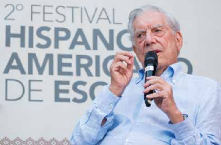
Mario Vargas Llosa