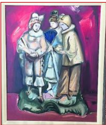
AUTORRETRATO DE ANTONIO PADRÓN: ÓLEO SOBRE LIENZO 1944/49